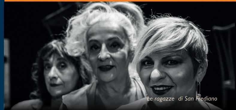
Le ragazze di San Frediano