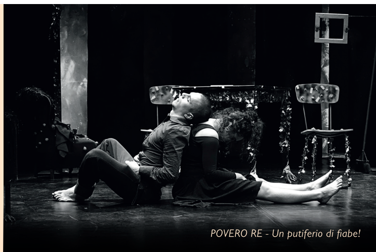
POVERO RE - Un putiferio di fiabe!